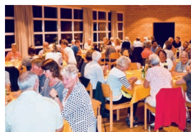
Nachtessen in der Brunnmatt

Wir freuen uns wiederum Ihre Gaben für den Erntedank-Gottesdienst zur Schmückung der Kirche entgegennehmen zu dürfen, damit frisches Obst, Gemüse, Brot oder Gebäck als Zeichen des Erntedanks sichtbar werden. Annahme Ihrer Naturalgaben: am Vorabend vor der ref. Kirche von 16.00–16.30 Uhr. Das Gependete kommt dem Wohnheim Paradies in Mettmenden zugute.